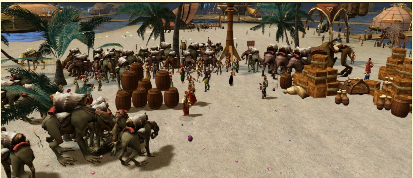
Caravane de mektoubs au départ de la route de l'eau à Fairheaven